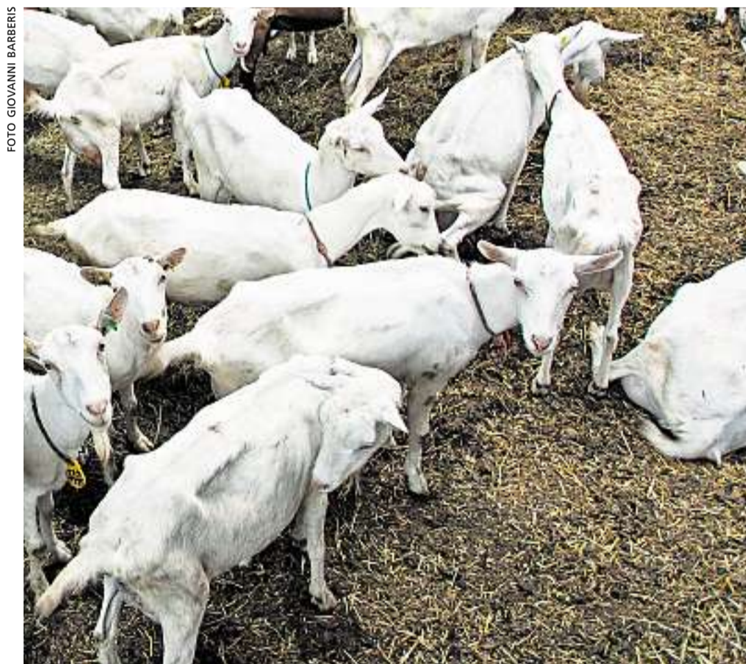
L'ottantina di capre di razza Saanen e camosciate possono uscire a pascolare all'aria aperta quando lo desiderano.