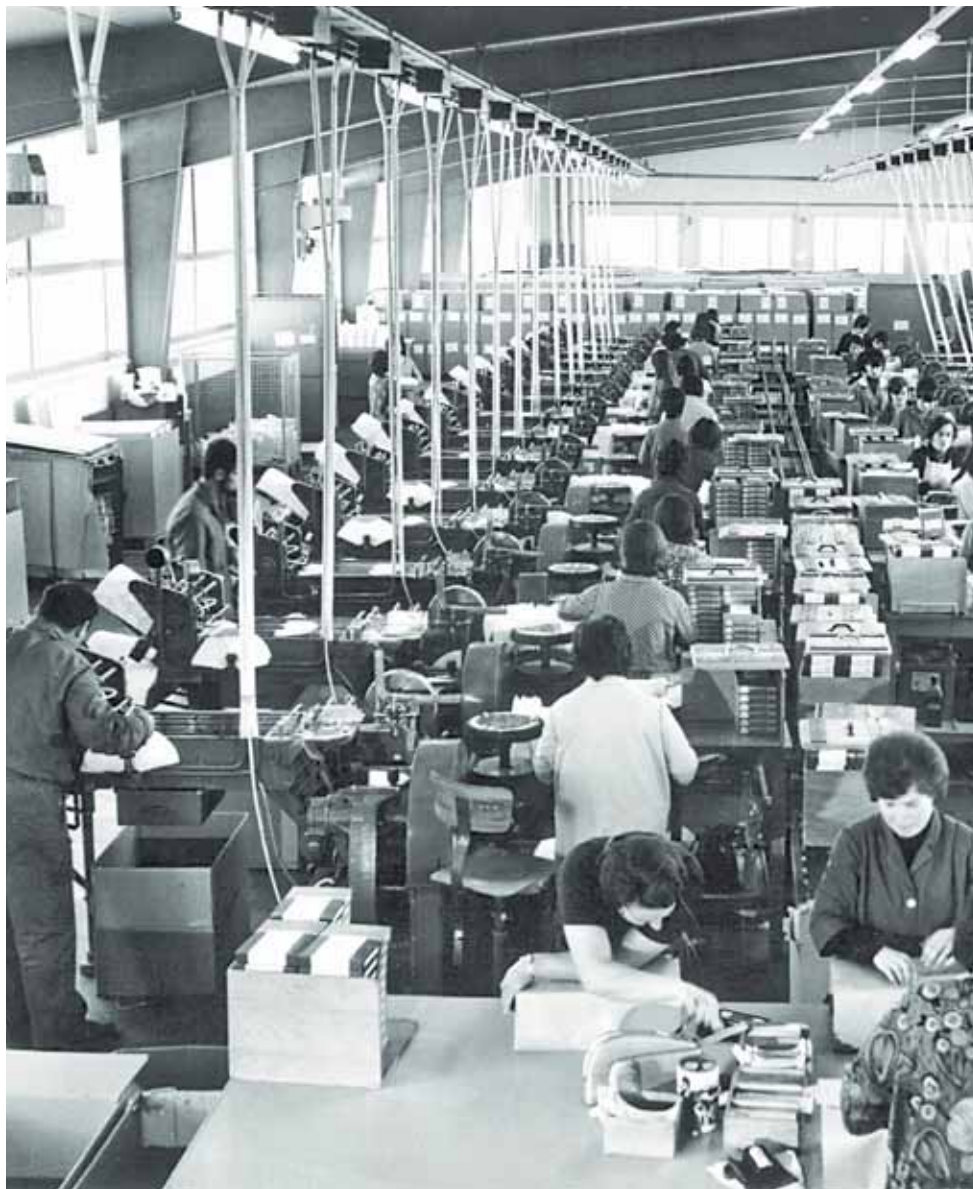
Im Gäupark Egerkingen bieten Bilder Einblick in Ereignisse und Institutionen, die das Gäu. Produktion der Firma Melitta im Jahr 1966.

Auf je zehn Meter langen Bildstrecken werden geschichtsträchtige Szenen wie etwa der Autobahnbau im Gäu und die Eröffnung der N2 Augst-Härkingen im Jahr 1970 oder aber die Geschichte der Firma Melitta Egerkingen dokumentiert. Die Melitta, einst die Marke für Kaffeegenuss schlechthin, ist indessen nicht nur auf Fotos im Shoppingcenter prä-