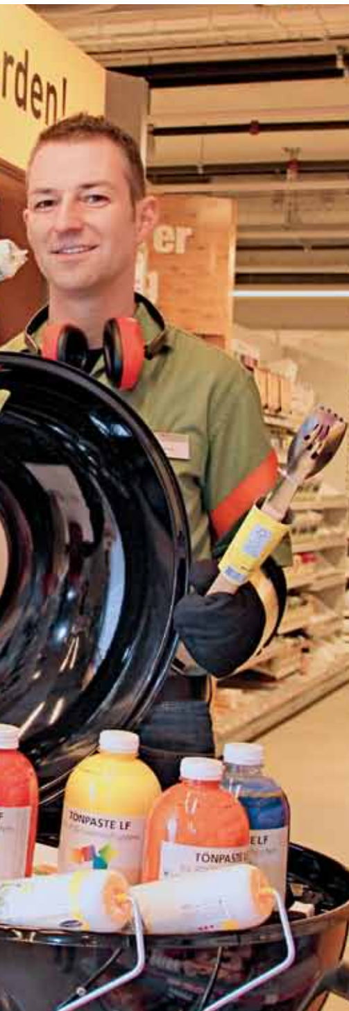
Länderpark zeigen, was sie können.