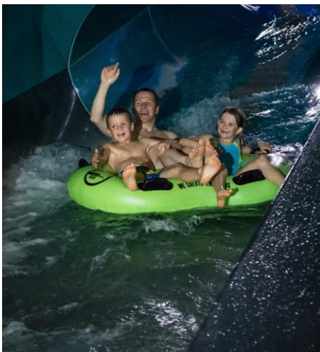
Familien kommen im Eiskanal auf ihre Kosten.

Genossenschaft Migros Ostschweiz Kommunikation / Kulturprozent/Sponsoring Industriestrasse 47 Postfach CH-9201 Gossau SG