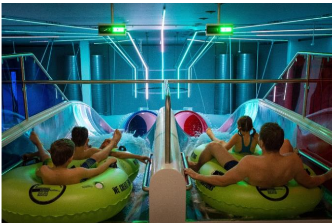
Wer ist schneller? Der Super-G ermöglicht Wettkämpfe.

Rutschenwelt: Montag bis Freitag 13.00 bis 22.00 Uhr, Samstag und Sonntag 8.00 bis 22.00 Uhr, Ferien- und Feiertage 9.00 bis 22.00 Uhr