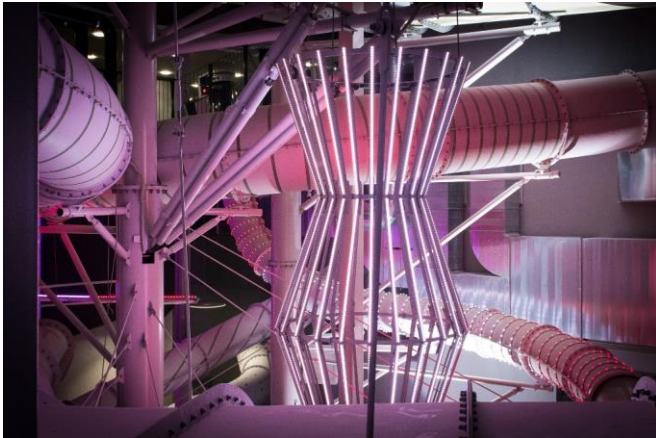
Verschiedene Lichteffekte bespielen die Rutschenwelt im Säntispark.